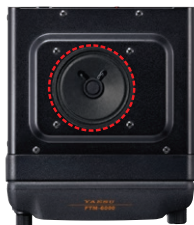
Altoparlante da 3 Watt (66 mm)

Un altoparlante da 3 W assicura un suono chiaro e frizzante. Il circuito è stato appositamente messo a punto per garantire un audio di qualità. Consente comunicazioni con audio di straordinaria qualità anche all'aperto o in ambienti rumorosi.