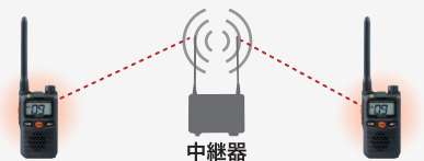
中継器接続で交互通話の約2倍にエリアを拡大

交互通話に加え、中継通話用チャンネルを装備しており中継器に接続することで交互通話の約2倍に通話エリアを拡大できる他、多層階のビル内や別棟との連絡、不感エリアの改善などに利用が可能です。