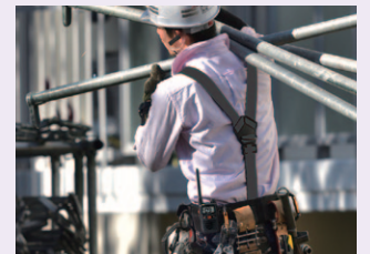
ケーブルレス Bluetoothヘッドセット利用イメージ