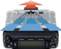
FACC冷却システムイメージ