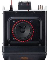
φ66mm/3W 高音質スピーカー

3Wの高音質・大音量の内蔵スピーカーを採用していますので、高品位で明瞭度の高い受信音質で通信を楽しむことができます。オーディオ回路には独自のチューニングが施されており、騒音の激しい屋外の使用でもクリアで快適な交信が可能です。