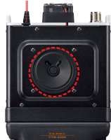
φ66mm/3W 高音質スピーカー

3Wの高音質・大音量の内蔵スピーカーを採用していますので、高品位で明瞭度の高い受信音質で通信を楽しむことができます。オーディオ回路には独自のチューニングが施されており、騒音の激しい屋外の使用でもクリアで快適な交信が可能です。