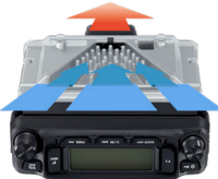
FACC冷却システムイメージ